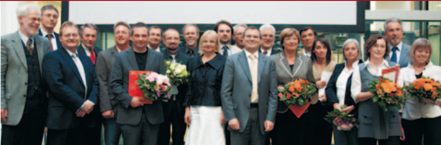
Grund zur Freude hatten Gewinner, Initiatoren und Laudatoren bei der Verleihung des Berliner Gesundheitspreises 2008: Bereits zum siebten Mal zeichneten der AOK-Bundesverband, die Ärztekammer Berlin und die AOK Berlin zukunftsweisende Modelle für eine bessere Versorgung von Patienten mit dem mit insgesamt 50.000 Euro Preisgeld dotierten Innovationspreis aus.