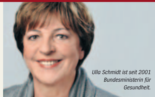
Ulla Schmidt ist seit 2001 Bundesministerin für Gesundheit.

Das Wissen über Erkrankungen, angemessene Therapien und den bestmöglichen Umgang damit muss verbessert werden. Das Bundesministerium für Gesundheit hat deshalb einen Workshop zur Sensibilisierung der Patienten veranstaltet